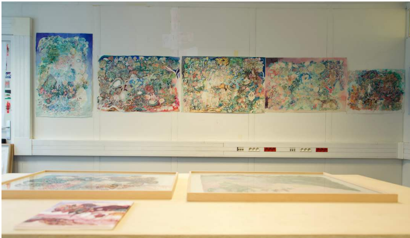
Vue de la Drawing Factory II, Atelier #56 Tamaris Borrelly