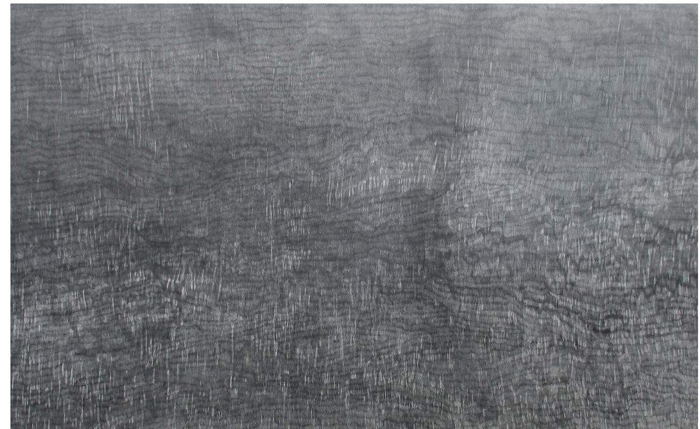
François Réau, Mesurer le temps , mine de plomb et graphite sur papier marouflé sur toile, 238 x 332 cm, 2017. Collection FRAC Alsace, France © François Réau.