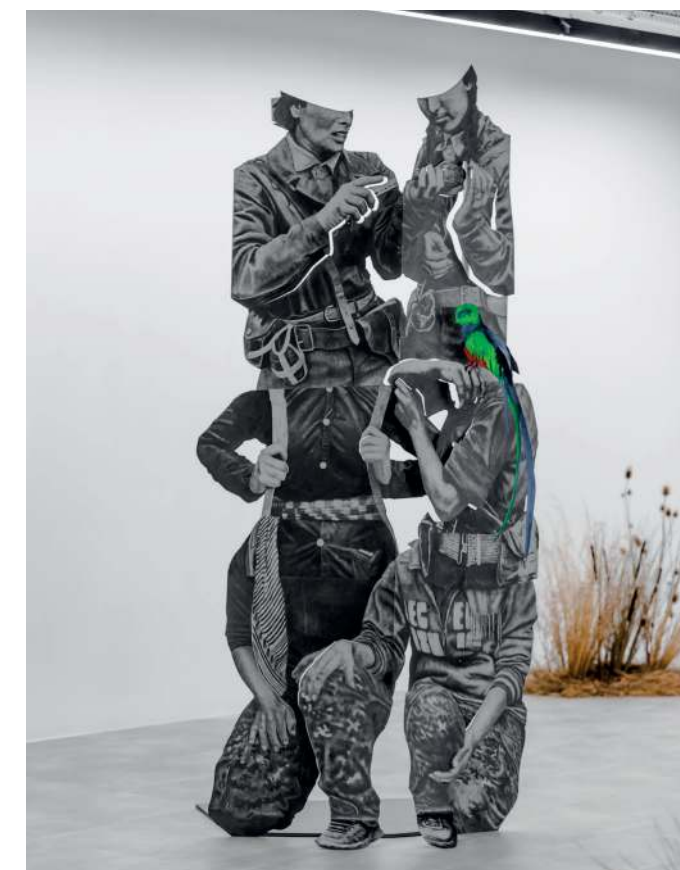
Vue de l'exposition Tierradentro , Daniel Otero Torres, commissariat Anaïs Lepage, 13 mars - 17 juin 2021, Production Drawing Lab

Depuis sa création, les actions du Drawing Lab ont accueilli plus de 24 000 visiteurs . La médiation culturelle et les ateliers pour enfants proposés aux publics permettent la transmission et la diffusion du travail des artistes soutenus.