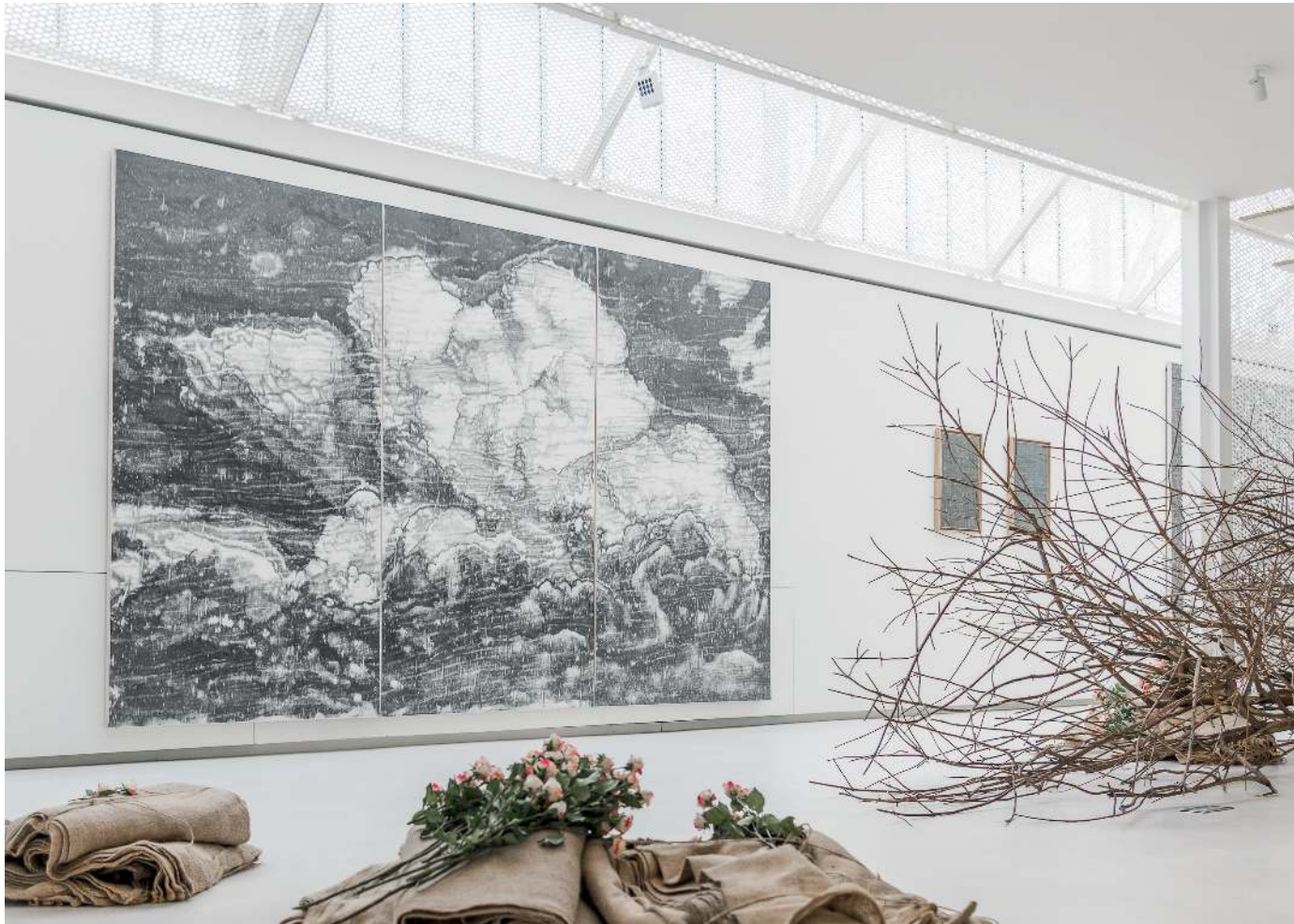
François Réau, To what extent X , 2021. Mine de plomb et graphite sur papier marouflé sur toile, 240 x 375 cm, collection particulière. Buddleia de David (arbre aux papillons), roses et sacs en toile de jute. Création in situ, dimensions variables. Vue d'exposition Sous l'orage des roses , Clavé Fine Art, Paris France 2022 © Adagp, Paris, 2022

Des dessins dans le ciel qui continuent de situer nos propres corps, nos individualités, entre deux points fictifs, entre deux plans, le premier : terrestre, et le second : céleste.