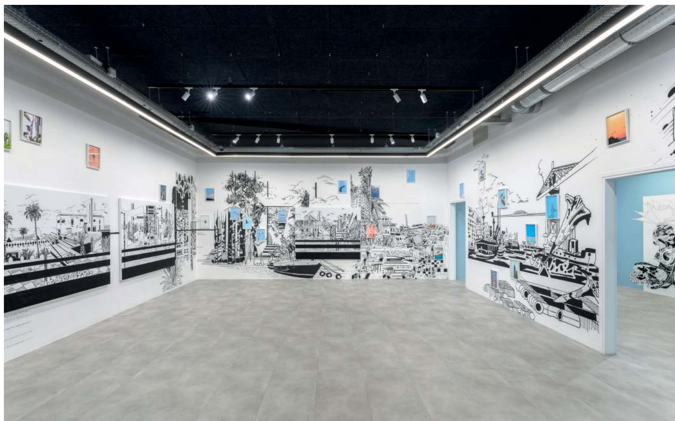
Vue de l'exposition I See a Bird / Je vois un oiseau , Chourouk Hriech, commissaire d'exposition Jérôme Sans, 18 mars - 15 juin 2022, Production Drawing Lab

En 2021, le Drawing Lab a imaginé et accompagné, avec le Centre national des arts plastiques, 33 jeunes artistes dessinateurs lors d'une résidence inédite de 6 mois dans un ancien hôtel parisien : la Drawing Factory.