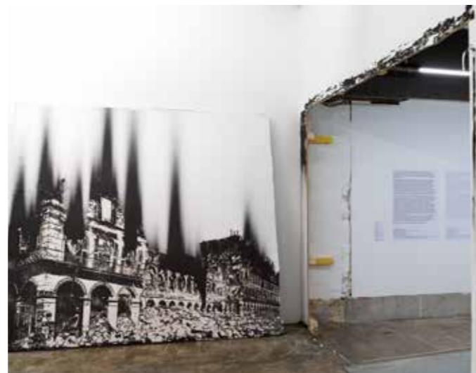
À gauche : Nicolas Daubanes, La fièvre , 2021, exposition « La rage », Marseille, Vidéochroniques, 2021 À droite : Nicolas Daubanes, Ministère des finances, 1871 , 2020, exposition « L'Huile et l'Eau », Paris, Palais de Tokyo, 2020. Collection Fonds d'art contemporain – Paris collection