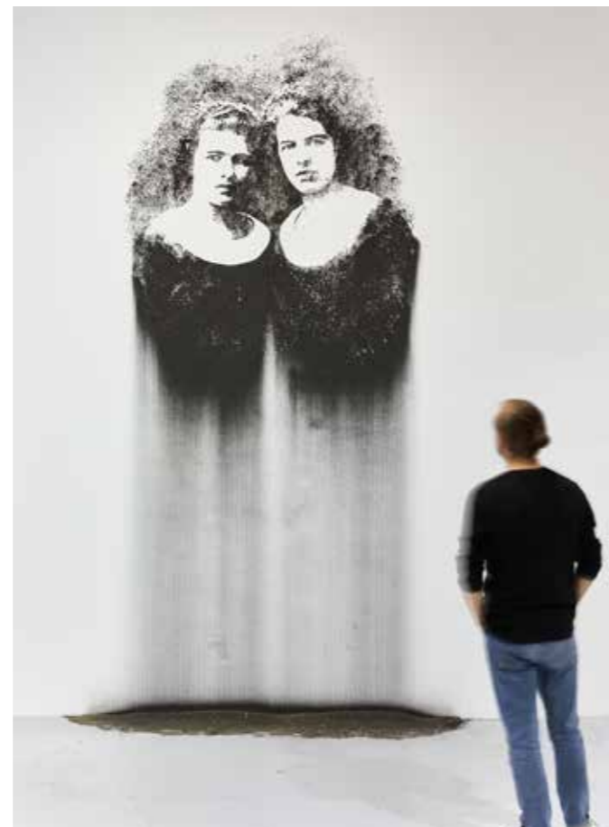
À gauche : Nicolas Daubanes, A colony without women , 2021, Paréidolie – Salon international du dessin contemporain », Marseille, château de Servières, 2021 © Jean-Christophe Lett