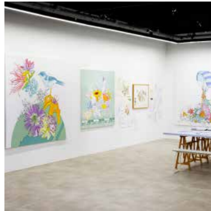
À gauche : Vue de l'exposition Danse de travers , Christian Lhopital, commissariat Jean Hubert Martin, 16 octobre 2018 - 9 janvier 2019, Production Drawing Lab