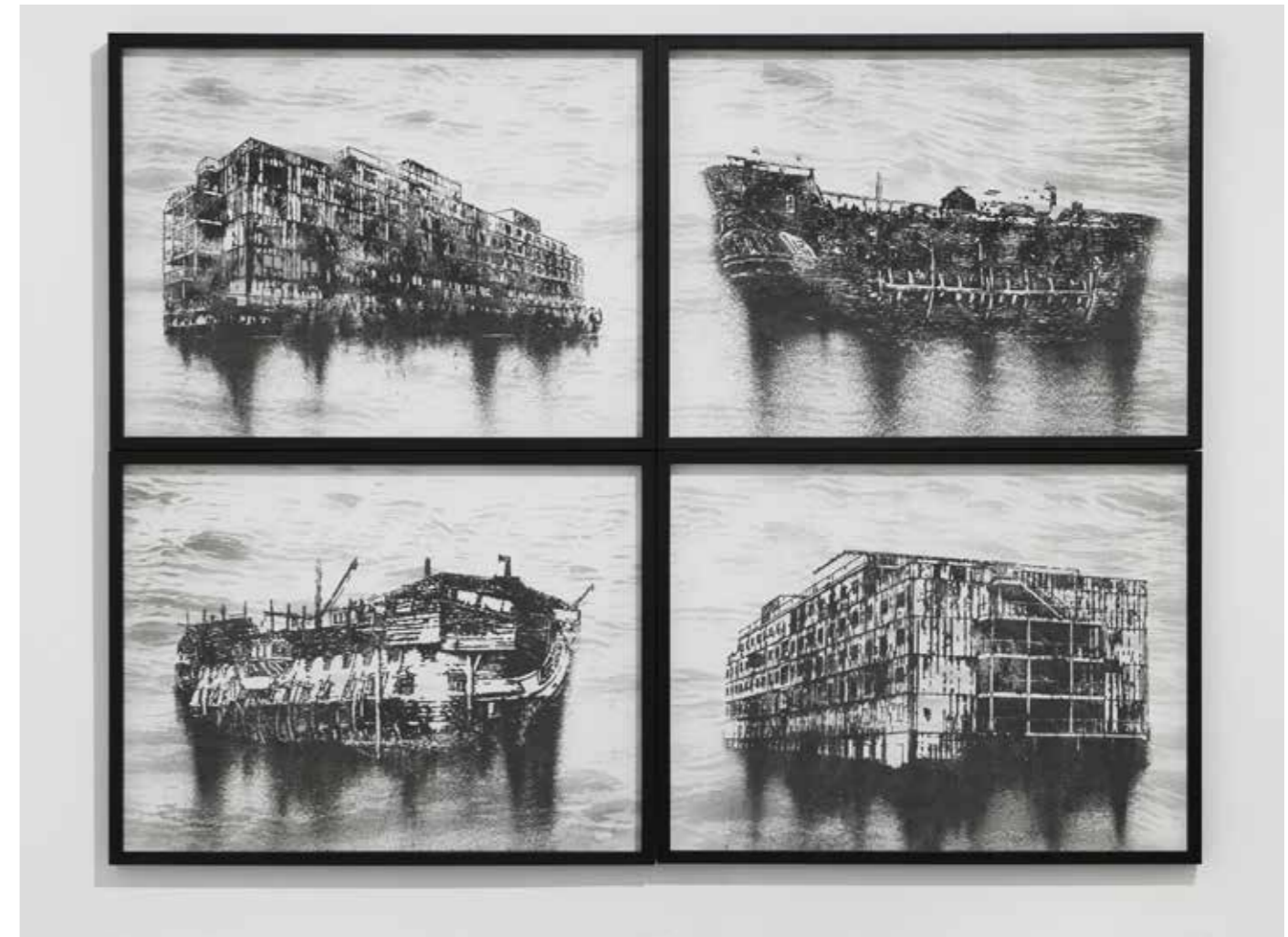
Nicolas Daubanes, Prison Ships , 2020. Incrustation d'acier incandescent sur verre et poudre d'acier aimantée, 120 x 160 cm