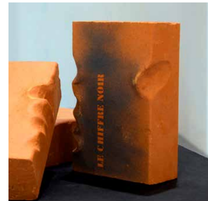
Nicolas Daubanes, édition limitée Le Chiffre Noir