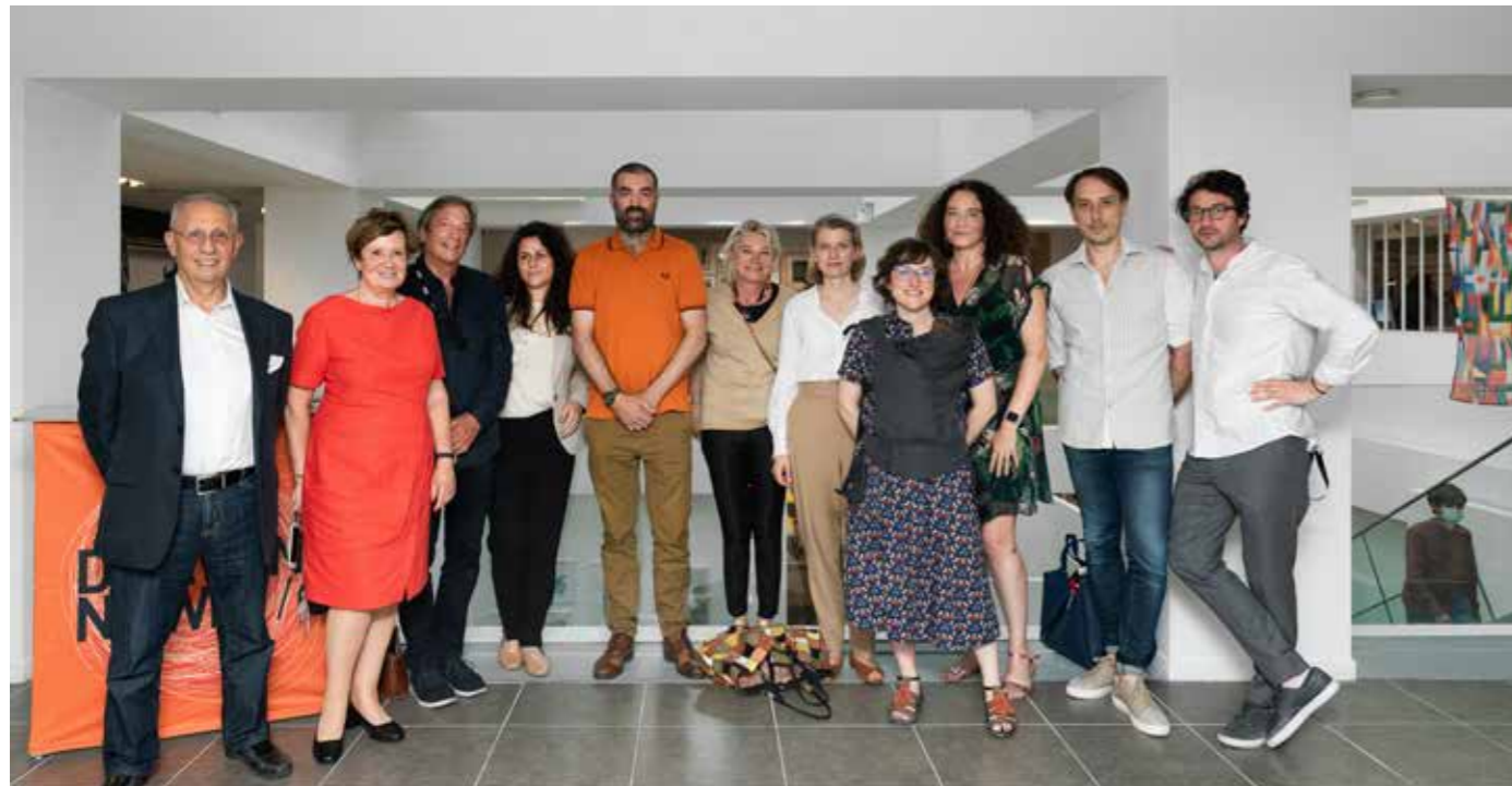
Remise du prix Drawing Now Alternative 2021