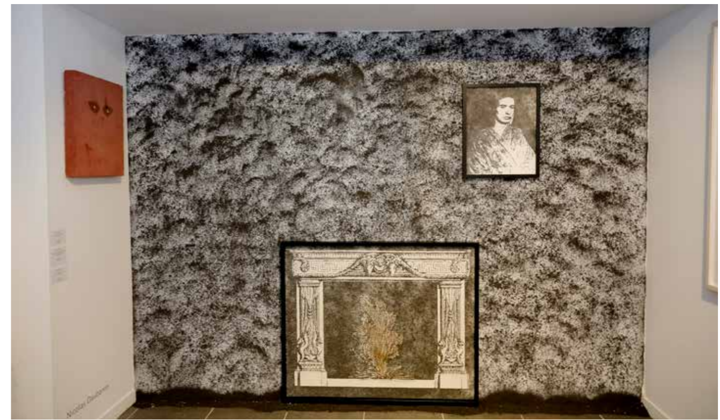
Vue du salon, Drawing Now Alternative, édition 2021, stand Galerie Maubert