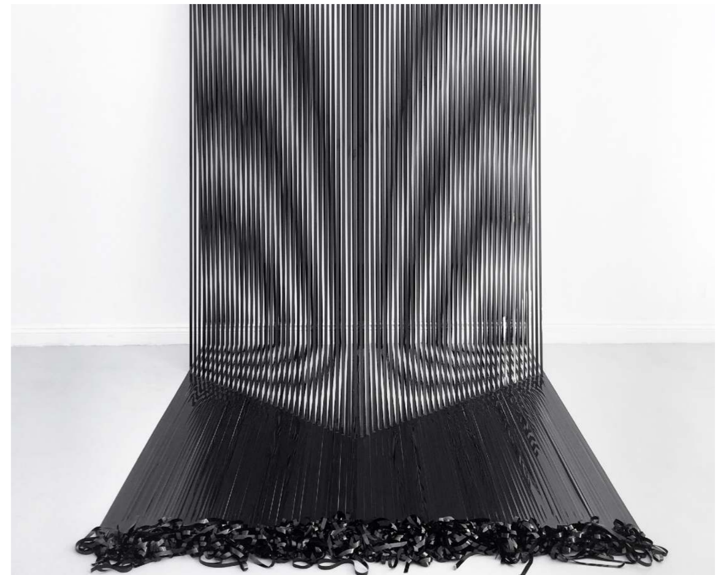
Variations on Line n10 , 2019. Spatial drawing, VHS magnetic tape, variable dimensions. Exhibition view at XcHuA Gallery, Berlin

Le centre d'art, situé au niveau -1 du Drawing Hotel, est ouvert au public tous les jours de 11h à 19h gratuitement.