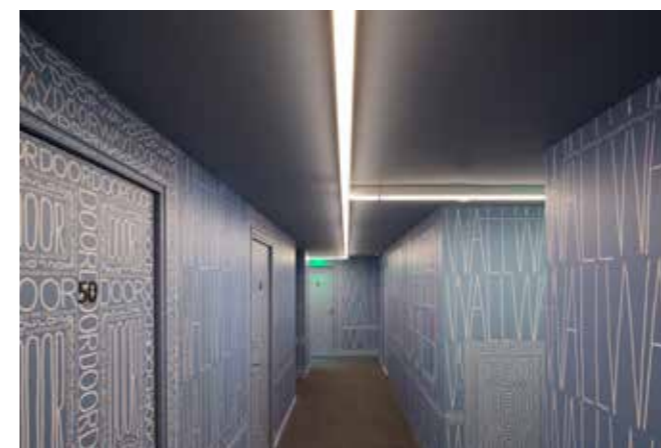
Drawing Hotel, 5ème étage - Thomas Broomé