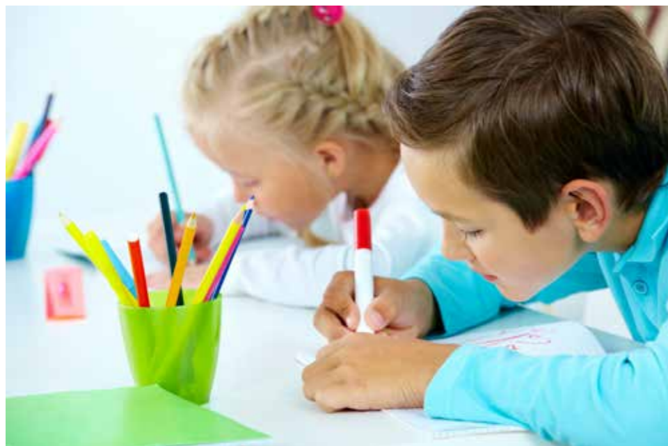
Atelier Drawing Kids du Drawing Lab