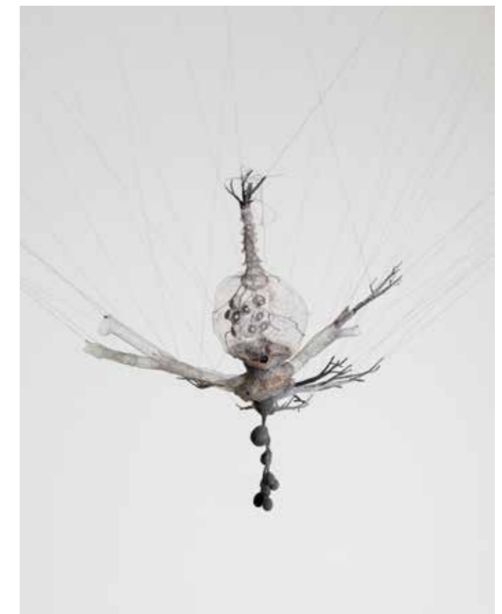
Gaëlle Chotard, Dessous , 2007, fil de métal, coton, polyester, 47 x 40 x 26 cm