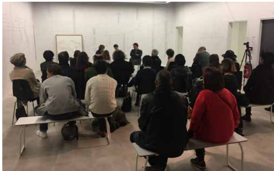
Talk autour de l'exposition «Keita Mori, Strings» au Drawing Lab