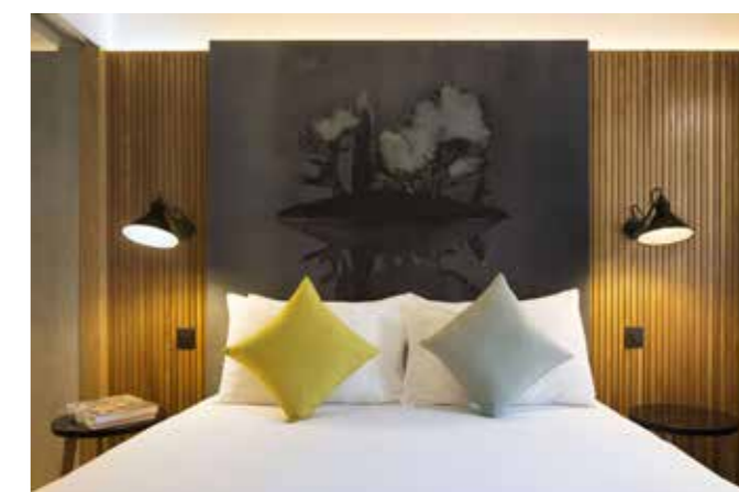
Drawing Hotel, 4ème étage - Françoise Pétrovitch