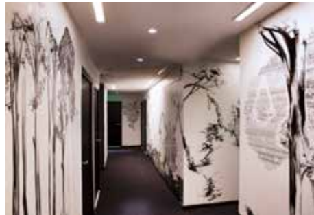
Drawing Hotel, 2ème étage - Abdelkader Benchamma