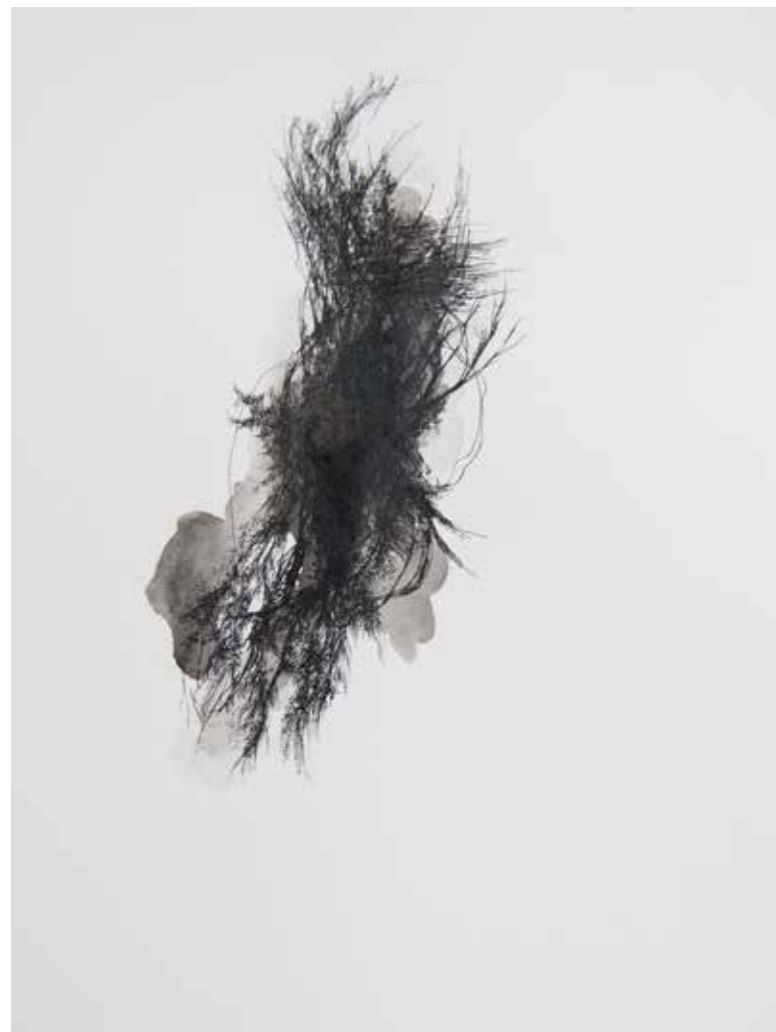
Gaëlle Chotard, Sans titre , 2017, encre de chine sur papier, 23 x 31 cm

« Sauras-tu jamais ce qui me traverse Ce qui me bouleverse et qui m'envahit Sauras-tu jamais ce qui me transperce Ce que j'ai trahi quand j'ai tressailli »*