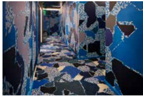
Drawing Hotel, 1er étage - Lek & Sowat