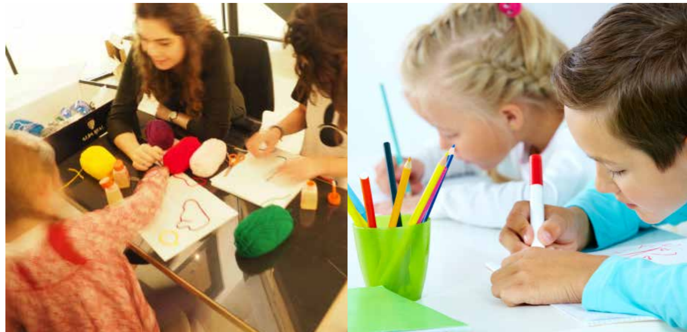
Atelier Drawing Kids du Drawing Lab