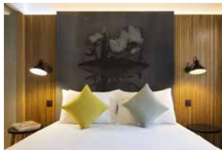
Drawing Hotel, 4ème étage - Françoise Pétrovitch

Le Drawing Hotel a ouvert ses portes en février 2017. Ce boutique hôtel d'exception de 48 chambres est un vrai concentré d'originalité.